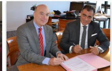
Photos : activités 2016 du conseil d'administration d'ECE